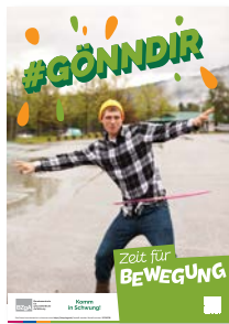
Poster DIN A3 Komm in Schwung! #gönndir Zeit für Bewegung Best.-Nr.: 35700720 Anzahl: .....