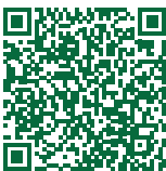
Videoclips #gönndir Zeit für Bewegung • Der traurige Stuhl! (0:27) • Like-Daumen (0:48) • Endlich wieder draußen! (0:32) • Mach dein Ding! (0:41)