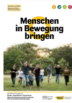
Broschüre DIN A5 Menschen in Bewegung bringen Best.-Nr.: 60640104 Anzahl: .....