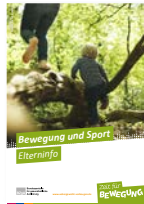
Broschüre DIN A5 Bewegung und Sport Elterninfo Best.-Nr.: 11041407 Anzahl: .....