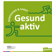
Broschüre 14,8 x 14,8 cm Bewegung & Sport Gesund aktiv Best.-Nr.: 35700717 Anzahl: .....