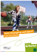
Flyer DIN A5 Hallo Bewegung und Sport! Tschüss Schweinehund! Best.-Nr.: 35422003 Anzahl: .....