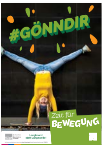
Poster DIN A3 Longboard statt Langeweile! #gönndir Zeit für Bewegung Best.-Nr.: 35700719 Anzahl: .....

Höchstbestellmenge 50 Stück pro Artikel Stand: 04.2023