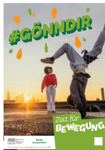
Poster DIN A3 Beste Aussichten! #gönndir Zeit für Bewegung Best.-Nr.: 35700721 Anzahl: .....