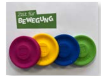
Kleine Frisbee Zeit für Bewegung Best.-Nr.: rot 35700750 Anzahl: ..... blau 35700751 Anzahl: ..... orange 35700752 Anzahl: ..... grün 35700753 Anzahl: .....