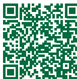
Sechs Checklisten oder Pläne als PDF zum Download Mitmachangebote Ernährung, Bewegung, Stressregulation